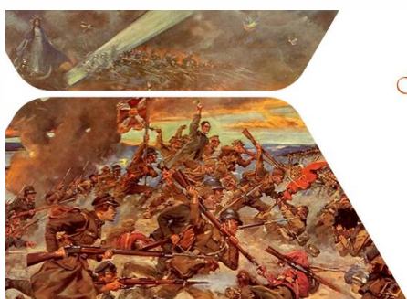
Bitwa warszawska 1920 r.